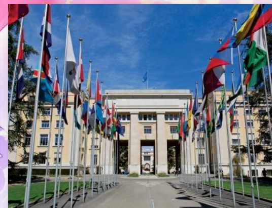
Здание ООН в Женеве