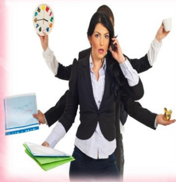
Много рук - много дел