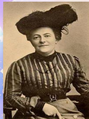
Клара Цеткин (1857-1933)

В 1910 году Клара Цеткин предложила учредить Международный женский день.