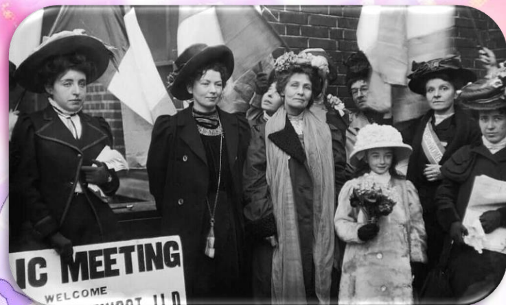
«Марш пустых кастрюль»

История события берет начало 8 марта 1857 года, когда в Нью-Йорке прошел «марш пустых кастрюль» работниц текстильной промышленности. Своей акцией они обратили внимание общественности на ущемление прав женщин. Участницы марша выступили за улучшение условий труда и его оплаты.